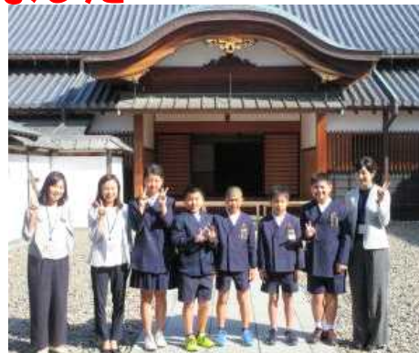
【長崎歴史文化博物館の前で】